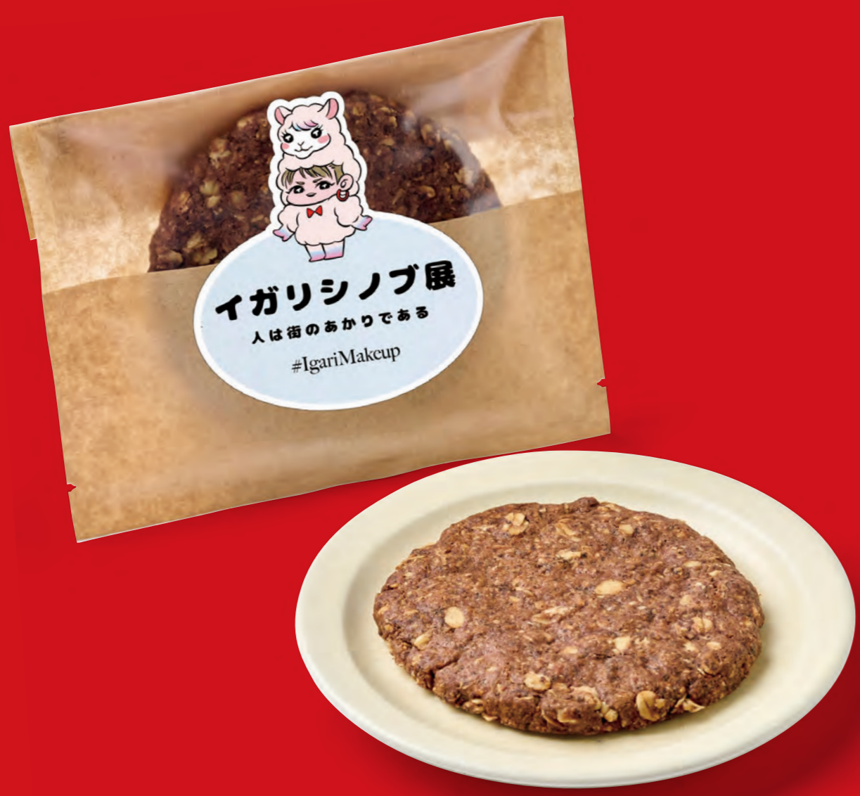
イロパカアールグレイクッキー

オートミールを使用したグルテンフリーのクッキー。 美容や健康に気をつけている方にも おすすめのスイーツです。