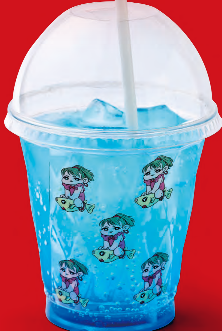
チョコメダカマンゴソーダ

イートイン ¥480 (tax in) テイクアウト ¥470 (tax in)