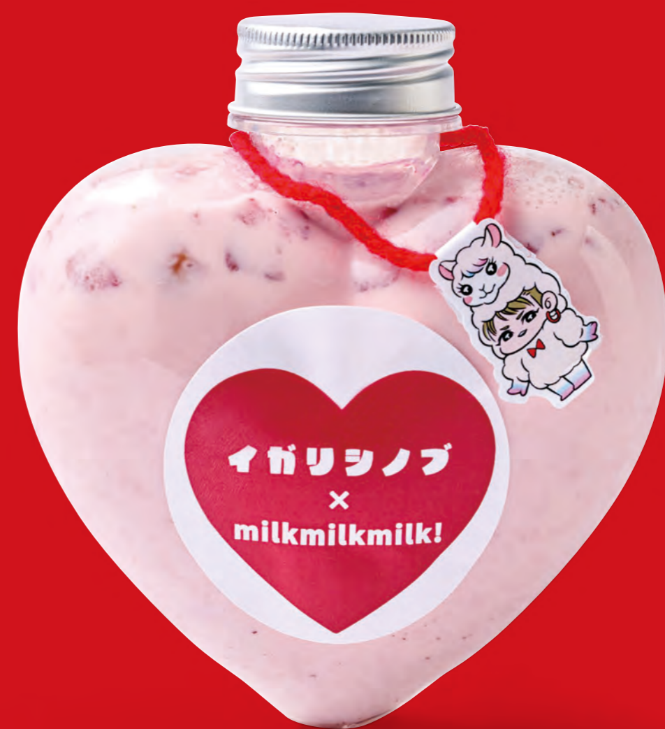
heart milk bottle

イートイン ¥880 (tax in) テイクアウト ¥864 (tax in)