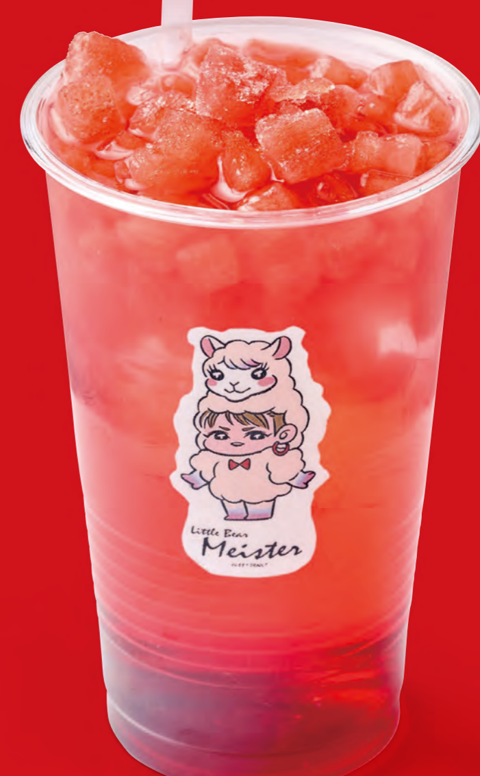
ストロベリーソーダ(クラッシュアイス付)

イートイン ¥680 (tax in) テイクアウト ¥660 (tax in)